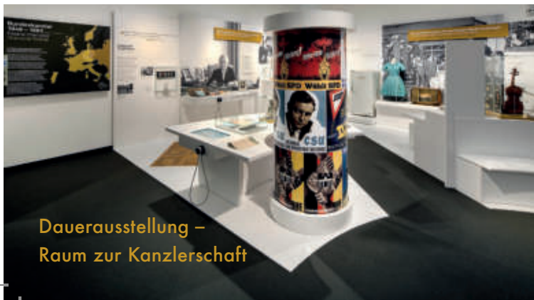
Dauerausstellung – Raum zur Kanzlerschaft

Die Ausstellung „Konrad Adenauer 1876–1967. Rheinländer, Deutscher, Europäer“ lädt zu einer Zeitreise durch Adenauers Leben ein. Seine bewegte Biographie wird im Kontext von fünf Epochen deutscher Geschichte erzählt. Exponate, Fotografien und Dokumente machen Geschichte erlebbar. Multimediale Stationen bieten einen vertiefenden und abwechslungsreichen Zugang zu den verschiedenen Politikfeldern.