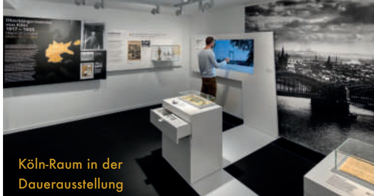
Köln-Raum in der Dauerausstellung

Interaktive Führungen und Workshops lassen die Schülerinnen und Schüler aktiv werden und regen zum Nachdenken über Geschichte und Politik an.